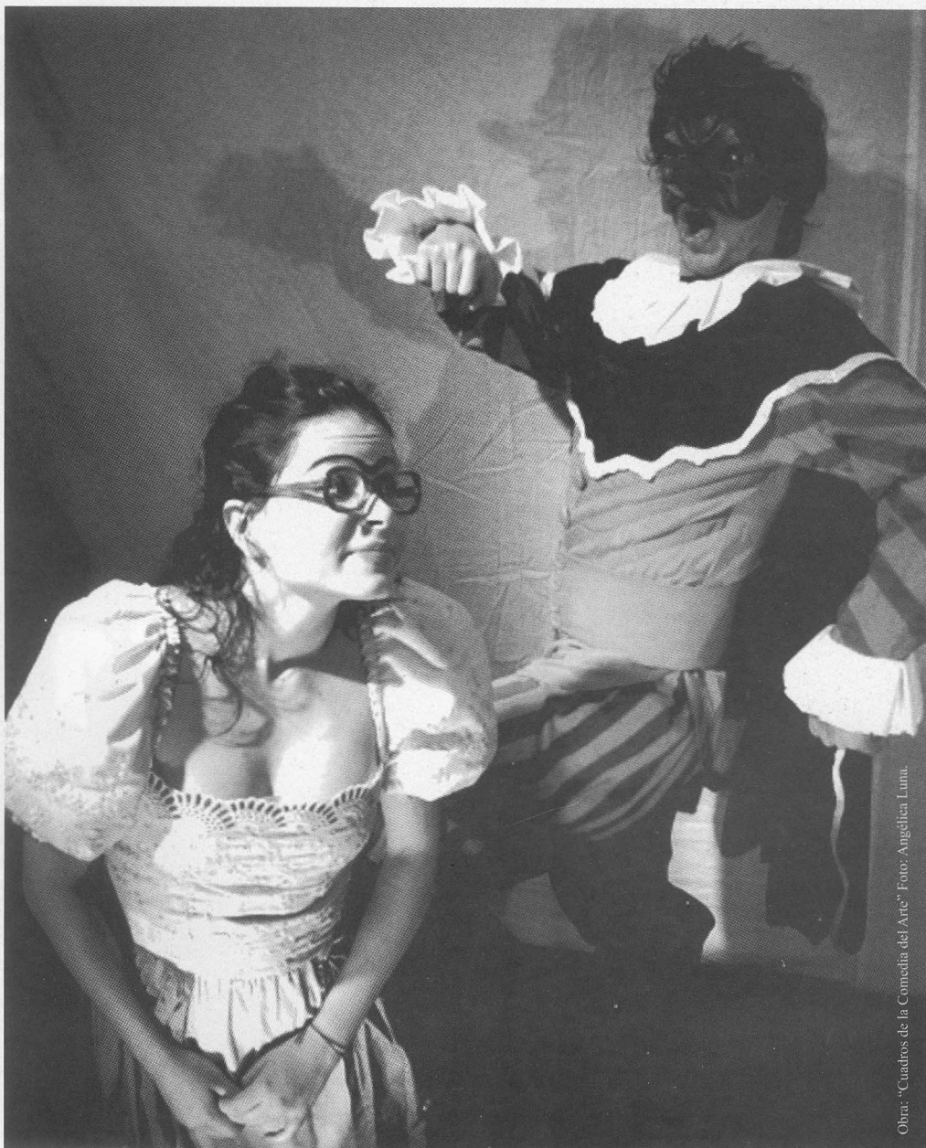
Obra: "Cuadros de la Comedia del Arte"