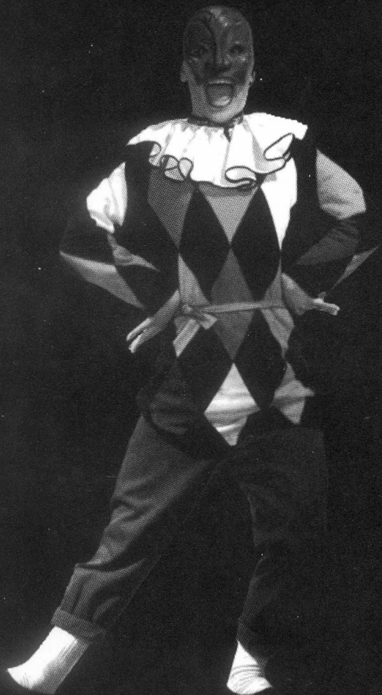
Obra: "Cuadros de la Comedia del Arte"

momento a un cerdo, en otro, a un cóndor; una prostituta quizá a un murciélago y tenemos cantidades... tortugas, lagartos, etc. Este recurso y apoyo en el mundo no humano, natural; produce un efecto de distanciamiento, de comparación crítica, permitiendo a su vez resaltar atributos del personaje absolutamente acentuados en el mundo no humano.