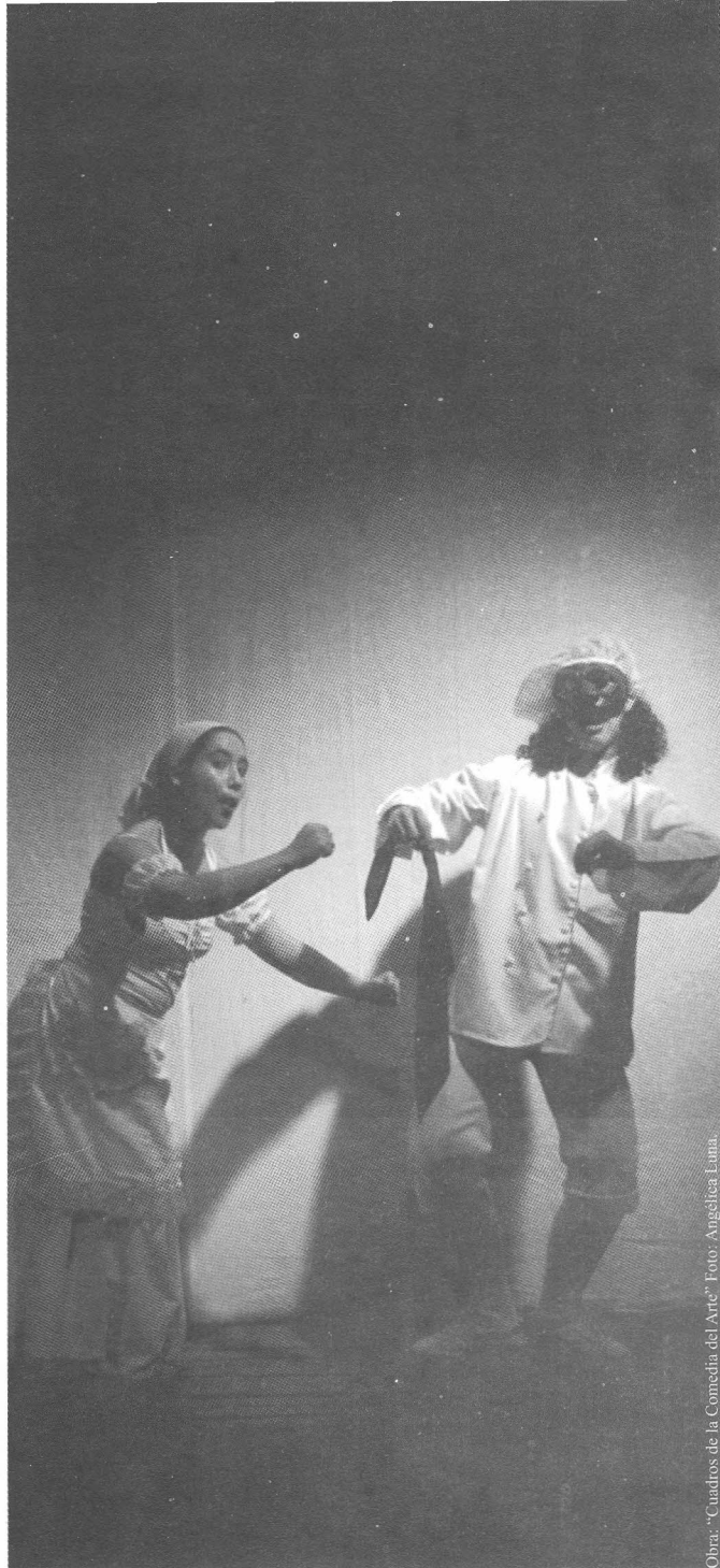
Obra: “Cuadros de la Comedia del Arte”.

Si usted desea producir un efecto cómico teatral, cree una situación en la cual los personajes con muy pocas variantes las reproduzcan en otras circunstancias. Ejemplo: En “El casamiento a la fuerza”, de Moliere, Sganarelle que espera casarse con