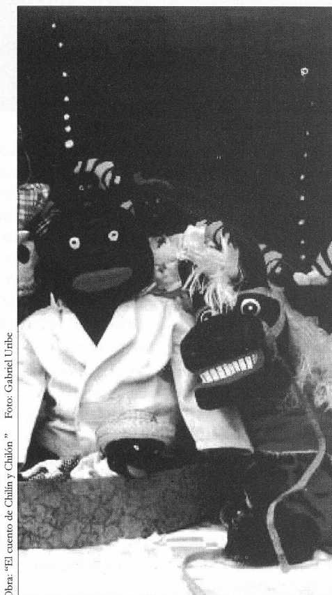
Obra: "El cuento de Chilin y Chifón"

La existencia del habla en el espectáculo de muñecos plantea un problema muy complejo y en muchas ocasiones con un mal nivel de resolución.