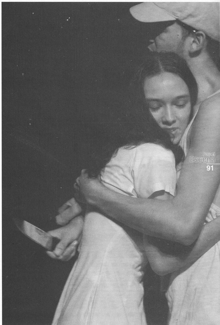
Obra: "Woyzeck"

TOPORKOV, V. O. Stanislavsky dirige . Fabril Editores Buenos Aires.