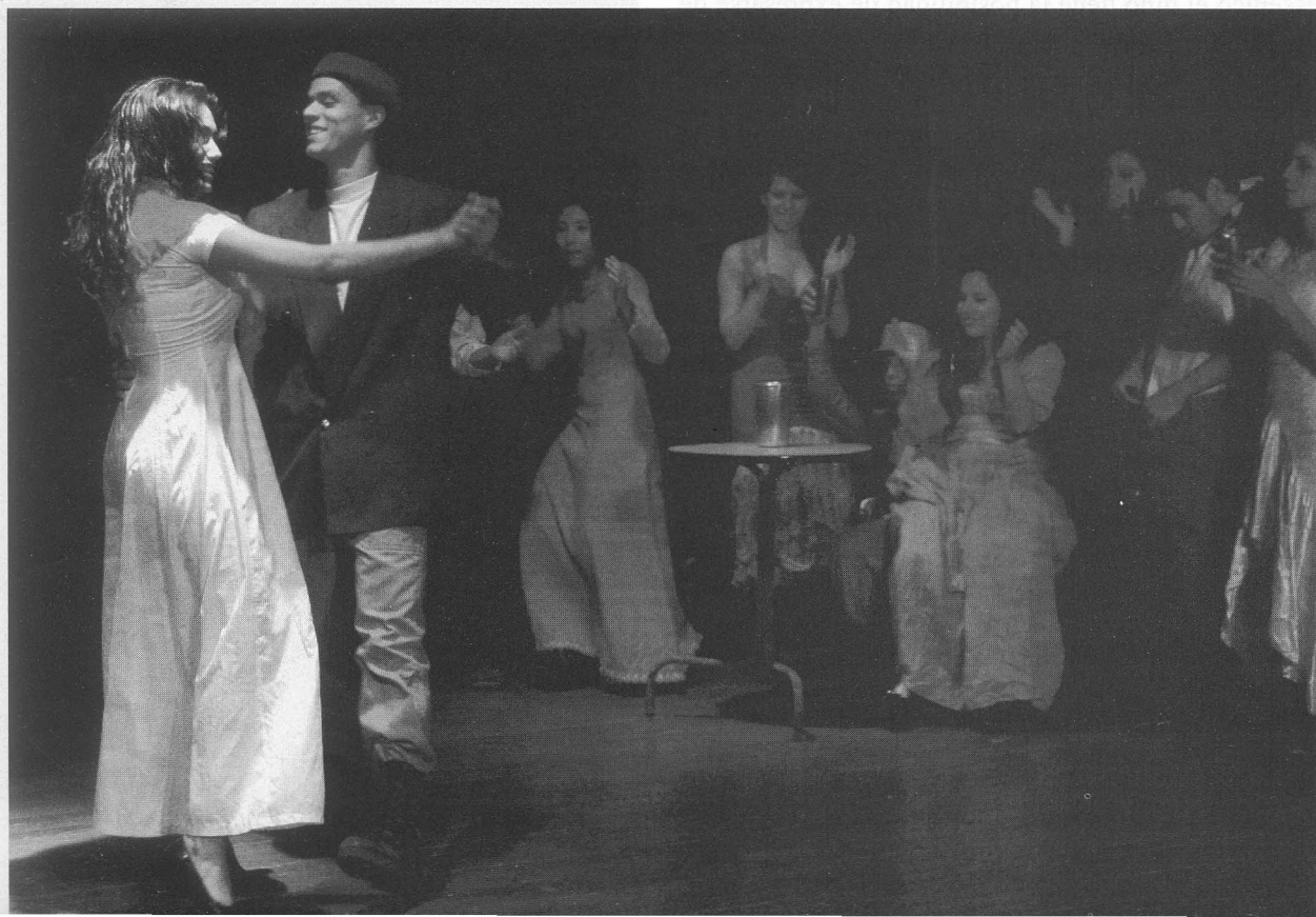
Obra: "Wóyczek"

Partiendo de la base que en el país existen ya decenas de artistas licenciados en arte dramático que deambulan ante la ceguera del Ministerio de Educación, vemos la imposibilidad de un diálogo con la educación