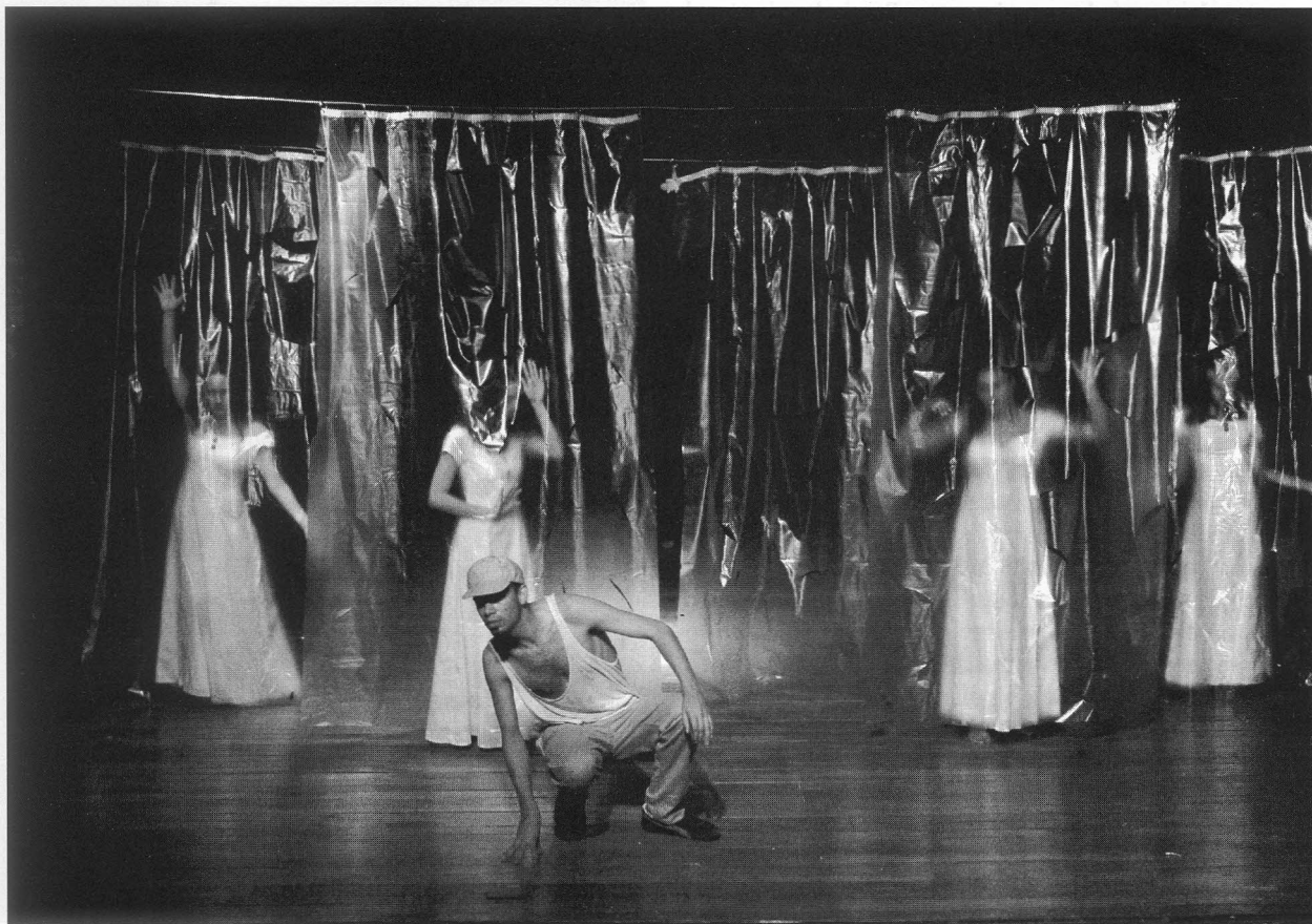
Obra : "Woyzeck"

gato y al ratón, entonces puede ocurrir una relación de entretenimiento; sólo que el papá lo más probable es que se va a cansar rapidito. Notemos por lo tanto, que esta pareja relacional entre el teatro y la pintura en los niños, nos lleva a formular que la hoja en blanco es como el espacio vacío (escenario) y la crayola, el cuerpo expresivo que juega. La cuestión es que algo puede ocurrir en la hoja en blanco, pero cuando el cuerpo es a su vez el instrumento estamos pues en una difícil situación. Cito a propósito un claro ejemplo