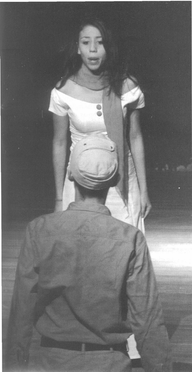
Obra: "Woyzeck"

por tanto situarnos en un común denominador y de esta manera teorizar sobre la praxis, encontrando su naturaleza, su especificidad, su natural esencia expresiva que nos va permitir sacar lo que necesitamos para ese paso educativo que estamos denominando teatro escolar.