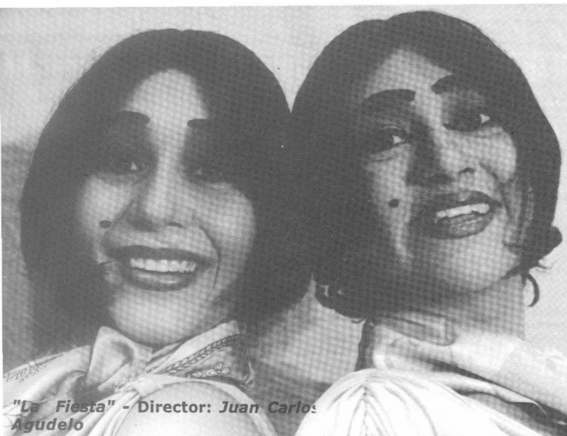
"La Fiesta" - Director: Juan Carlos Agudelo

epígrafe, "Quien ha visto la esperanza no la olvida, y sueña que un día va a encontrarla de nuevo." (Octavio Paz)