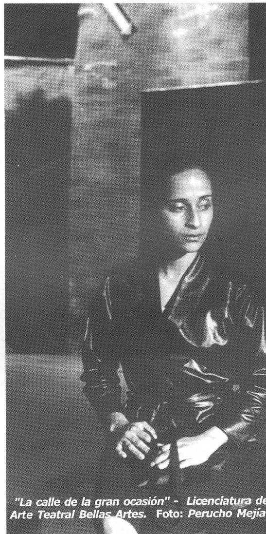
"La calle de la gran ocasión" - Licenciatura de Arte Teatral Bellas Artes.

marcado en el almanaque de celebraciones. Un festival de teatro como necesidad esperada por la ciudad,