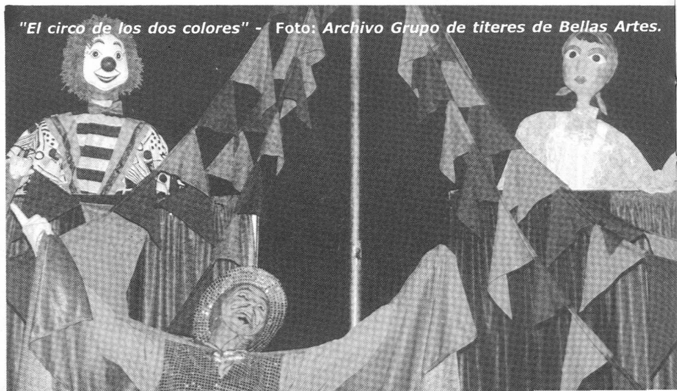
"El circo de los dos colores"