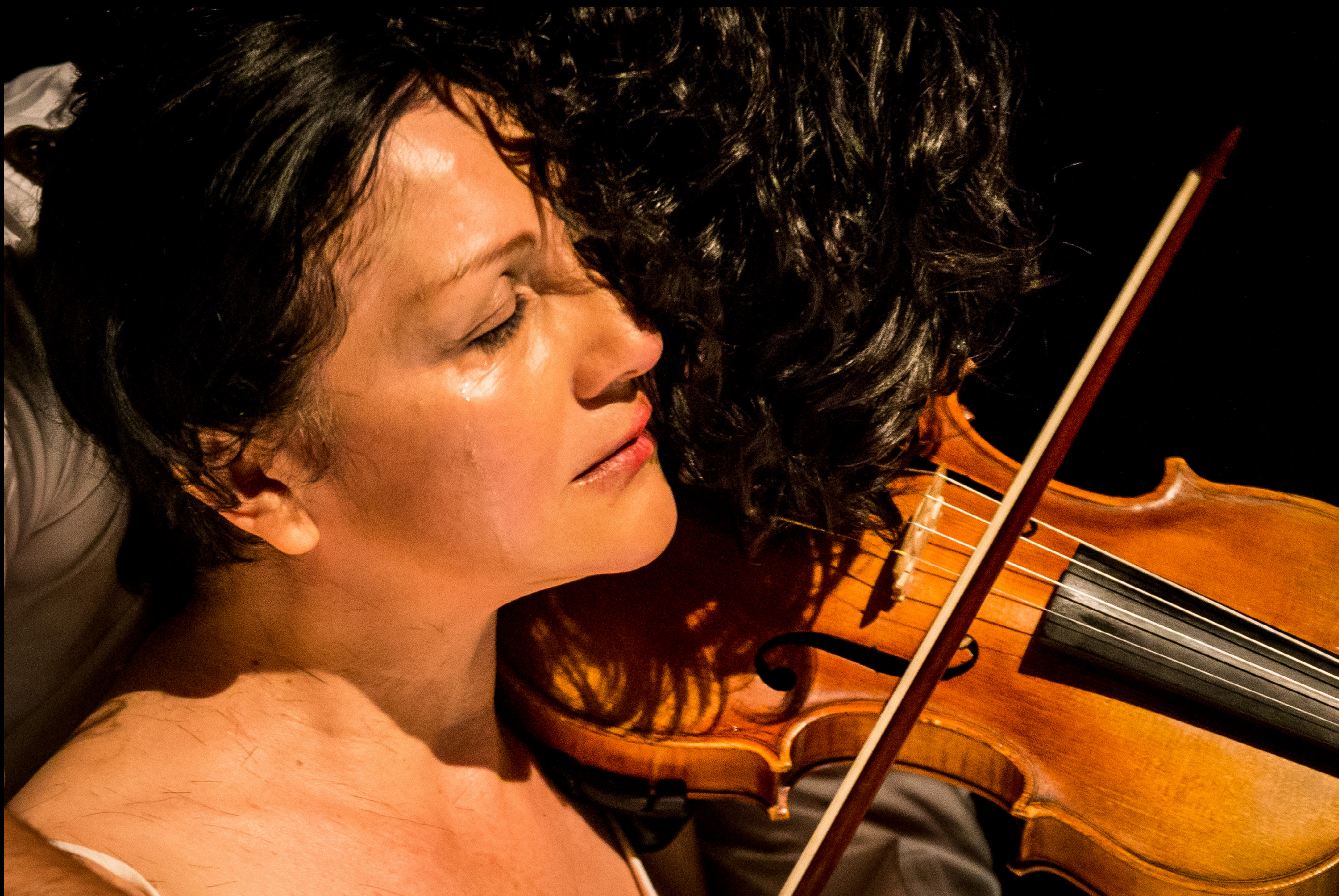
La razón de las ofelias