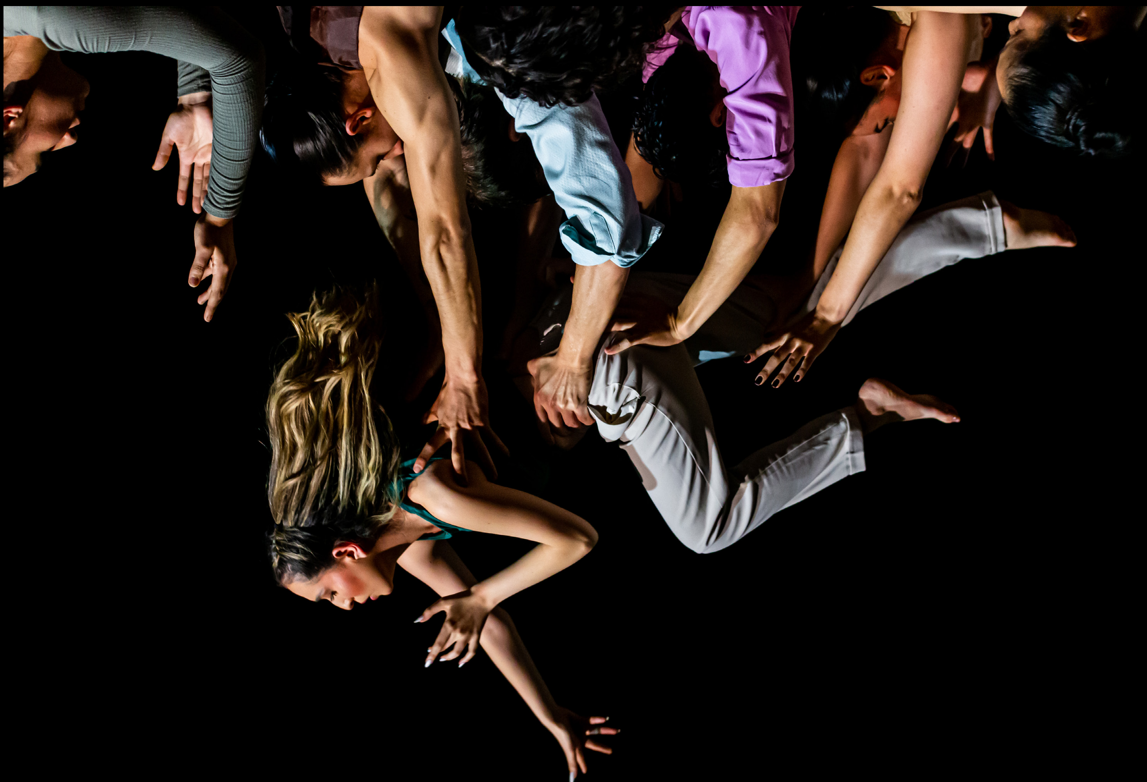
Seminario Cuerpo y Escena