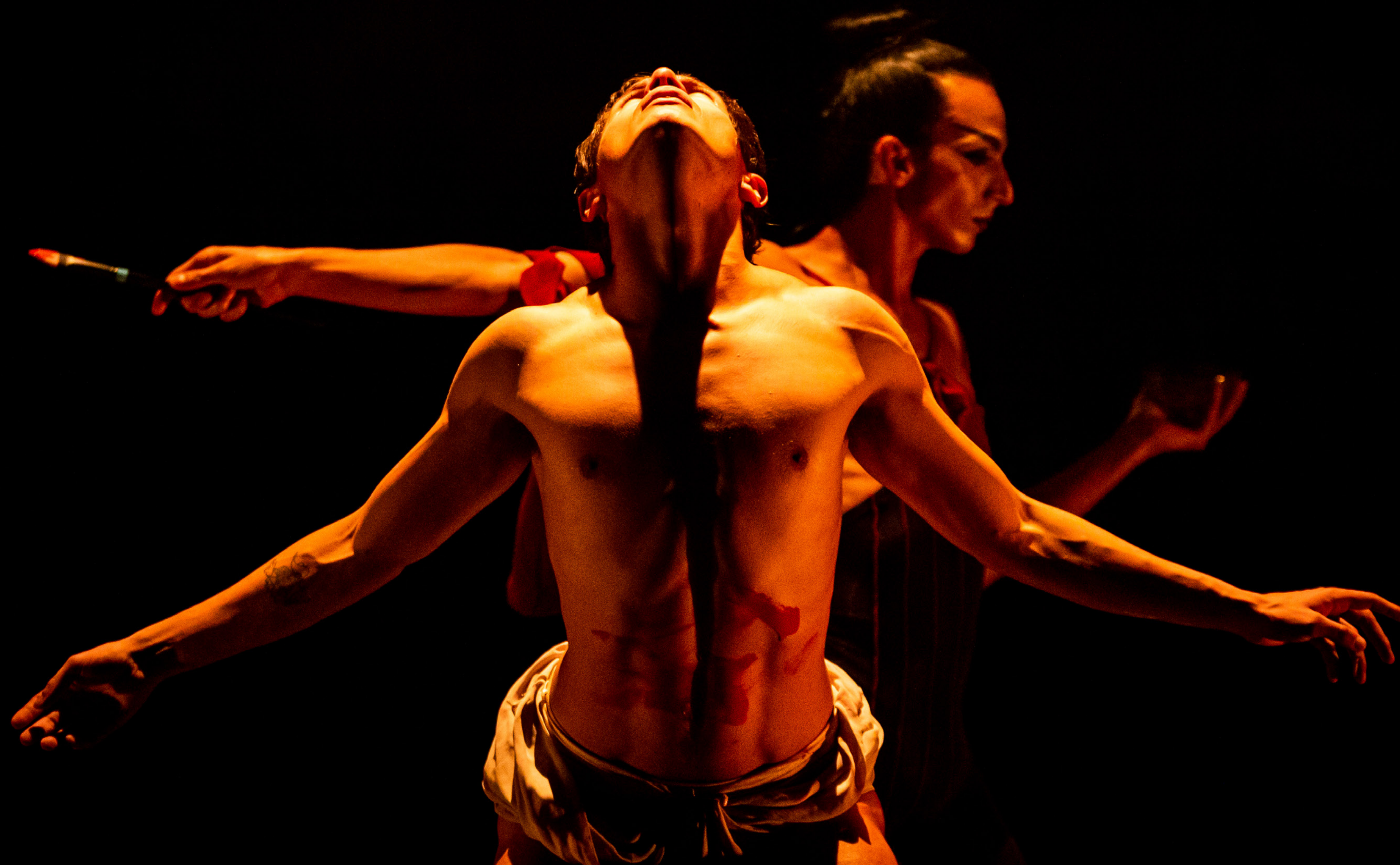
La muerte de Santiago Nassar