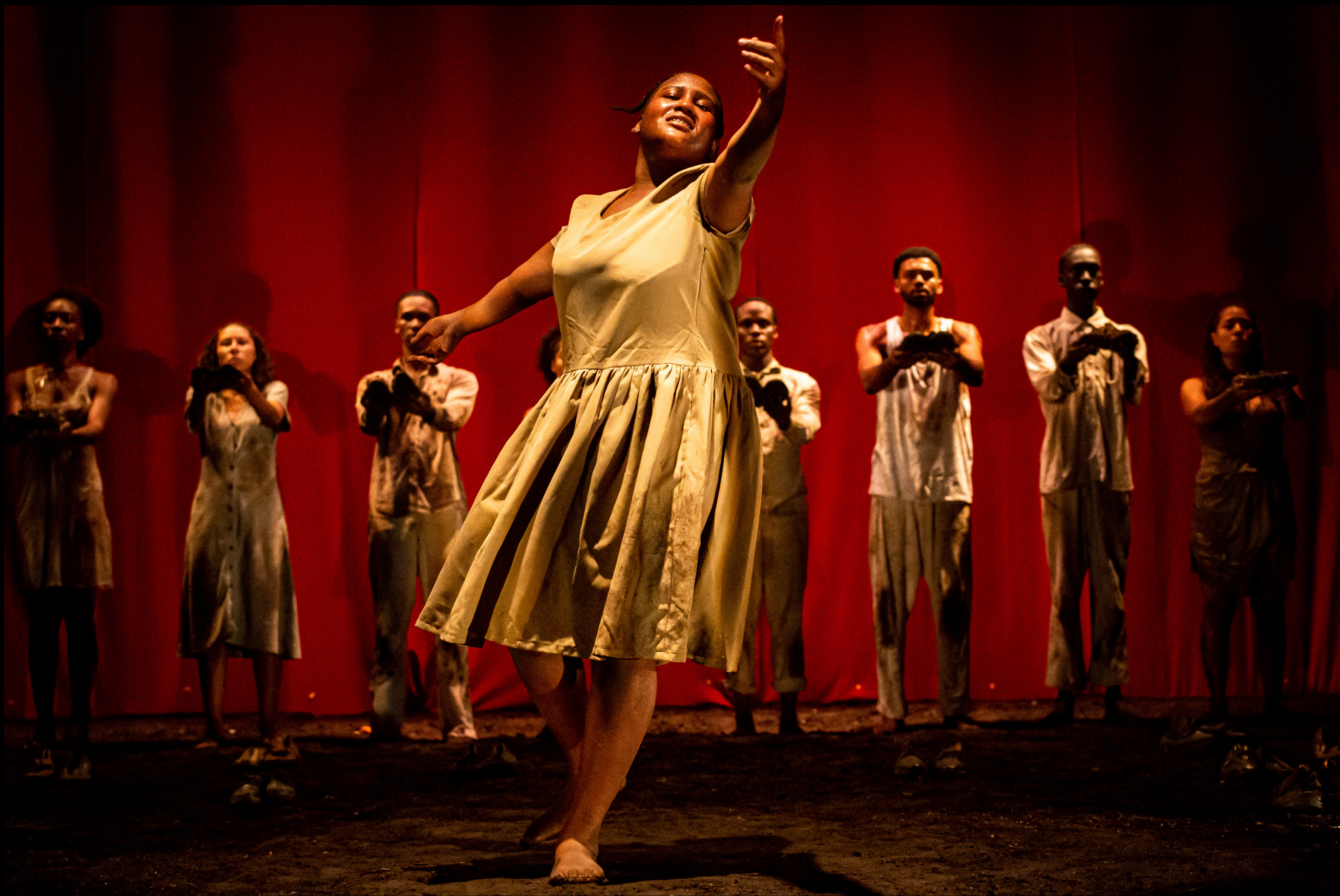
La mirada del avestruz. Dirección: Tino Fernández