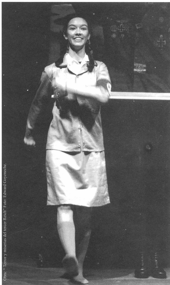
Obra: "Terror y miserias del tercer Reich".

RIZK, Beatriz J. La dramaturgia de Enrique Buenaventura . Tesis para optar al Título de Doctor en Filosofía. The City University of New York, 1990, 456 p.