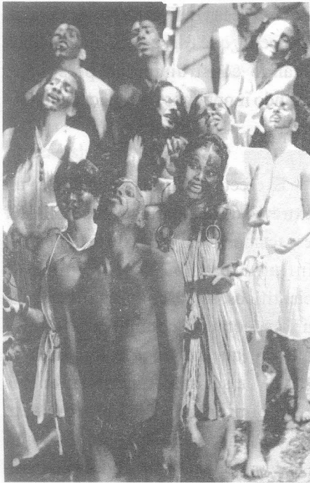
▲ Obra: «¿Quién no Tiene su Minotauro?»