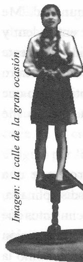
Imagen: la calle de la gran ocasión

quien, básicamente, se dirige el trabajo del ensayo, del error, de la puesta en escena. Hay en el imaginario individual y grupal del equipo, en este proceso creativo, un espectador ideal que lo activa, así no seamos conscientes de este fenómeno, y hacia quien va dirigido el efecto comunicativo que se pretende transmitir. El espectador implícito en el acto de creación.