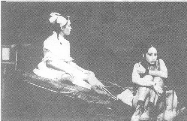
Obra: «Nocturno para Laura F»

La exploración sobre la imagen teatral, a partir del concepto de lo performativo. sugeridas para el montaje de “Paisaje con Argonautas” de Heiner Müller, produjo un trabajo escénico llamado “La Sangre o la Piedra”, pieza fragmentaria sobre el ser y la guerra dirigida por Hoover Delgado, quien lo explica así: inspirada